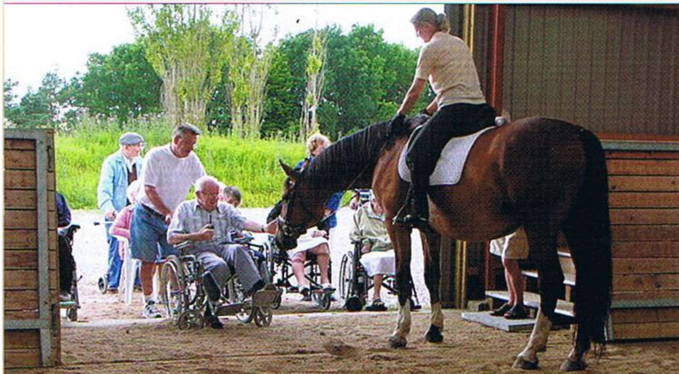
Beboere fra plejehjem er glade for at besøge gården - og for at møde alle dyrene.

gerne ville have det, var det oplagt at prøve, om vi ikke kunne lave nogle kurser for virksomheder. Vi har jo sådan nogle dejlige rammer at tilbyde. Der er jo noget specielt ved at rykke ud fra kontorerne og ud her på landet med svalereder og nattergale og blomstrende hyld. Det befordrer samtalen og åbner sanserne på en helt anden måde. Alene det at få lov at røre ved dyrene, ikke? Man kan ligesom lette-